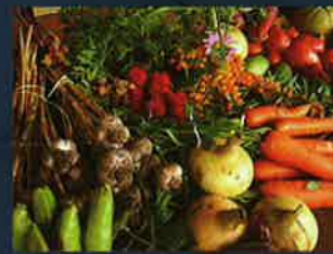
採用友善農法的無毒蔬果