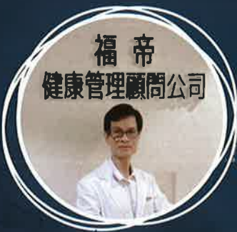
福弟 健康管理顧問公司