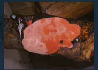
珍貴牛樟芝子實體入菜